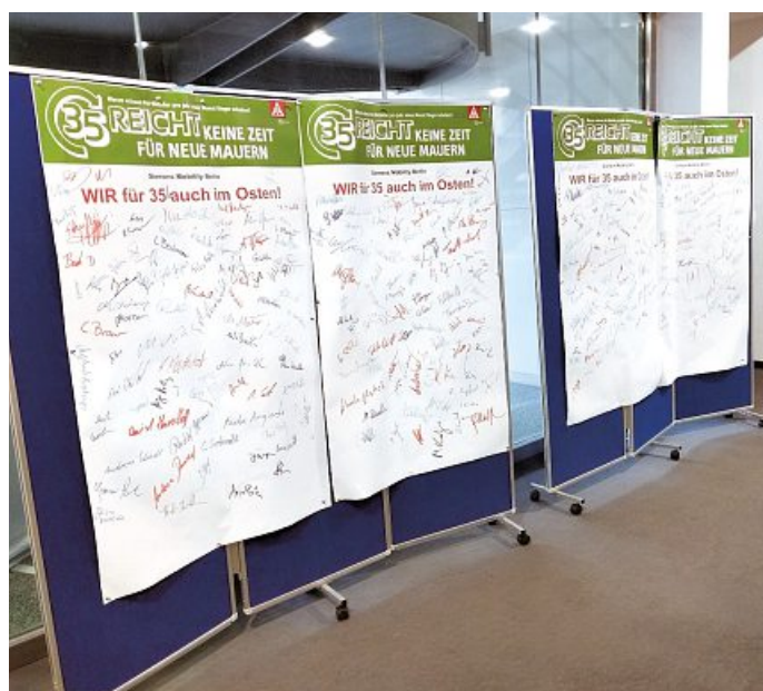
Bei einer Betriebsversammlung bei Siemens in Treptow entstanden diese Unterschriftenlisten für die Arbeitszeitverkürzung

„Endlich beginnt ein Prozess, der lange überfällig war. Offensichtlich wird den Arbeitgebern bewusst, dass sie die Problematik angehen müssen und nicht mehr vor sich herschieben können. In der Frage, dass es Sachsen wirtschaftlich sehr gut geht, stimmen wir durchaus überein. Mein Fazit: Es ist Zeit!“