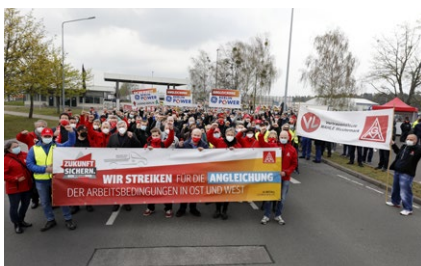
29.4. | Mercedes Benz Ludwigsfelde