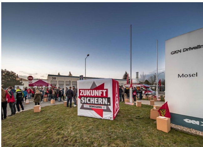
23.4. | GKN Driveline Deutschland