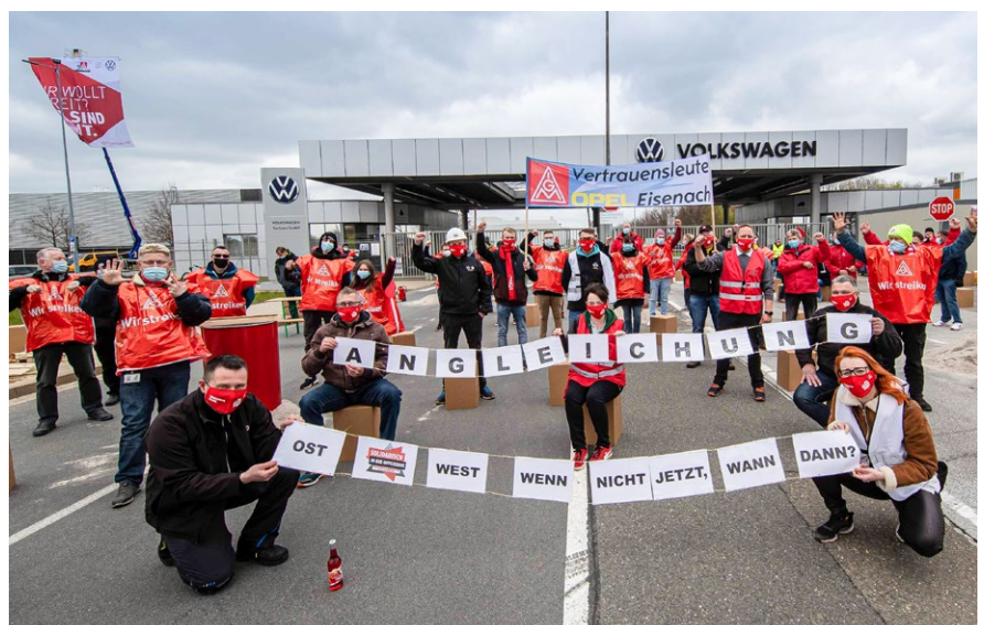
23.4. | VW Sachsen