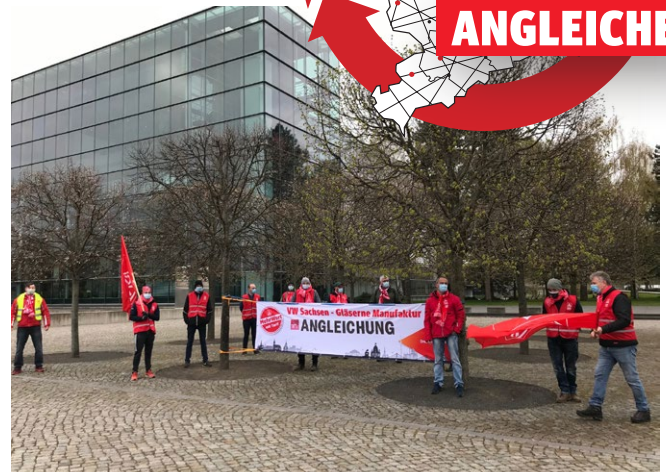
23.4. | VW Gläserne Manufaktur